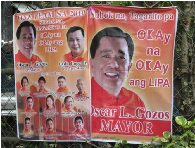
Hanging Candidates Everywhere